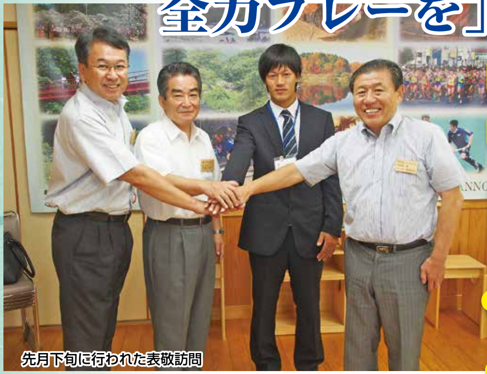
先月下旬に行われた表敬訪問